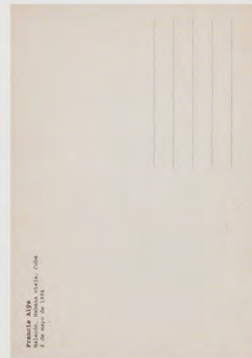
FRANCIS ALÿS, MAGNETIC SHOES , 1994, 5th Havana Biennale, postcard / MAGNETISCHE SCHUHE , Postkarte.

Charming—like his faux-naïf paintings—superficially capricious but also deftly disruptive and not infrequently saturnine Alÿs’s art is absurd as well, but in a disciplined and revealing way. If you remove the diagram upon which his activities have been configured and resist the temptation to impose another one with better academic credentials, you can readily see that all along he has been overlapping premises and procedures while connecting the dots between the quotidian poetics of the supercharged urban environment—a sleeping dog, a broken window patched with plastic—and the social and cultural tensions that condition whatever freedom the Baudelairian “flâneur” or contemporary nomad still has. There may not be much, but within the tightening coordinates of “global” reality as well as within the rigidifying theoretical matrices of conceptually oriented practice, Alÿs has found room for maneuver.