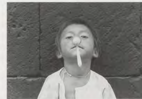
FRANCIS ALÿS, UNTITLED, Mexico D.F., 1991, photograph / Photographie.

Zeichnen wir nun zusätzlich eine weitere lange Linie aus Hunderten von Punkten ein, die sich in einer schrumpfenden Halbmondform unregelmässig schlängeln. Die Punkte sind Menschen, die Sand schaufeln, während sie einen kahlen Hügel hinaufsteigen. Durch ihre vereinte Anstrengung wurde ein winziger Teil der Masse des Hügel um eine unmessbar kleine räumliche Masseinheit verlagert. CUANDO LA FE MUEVE MONTAÑAS (Wenn der Glaube Berge versetzt, Lima 2002) ist ein Kollektivprojekt, das die Zusammenarbeit in Spaten voll staubiger Erde misst. Es ist zugleich eine sinnlose Übung, die auf den Stellenwert der körperlichen Arbeit im Zusammenhang mit Erdarbeiten pocht. Wenn wir Kunstrichtungen und Stilarten in ihrer jeweiligen