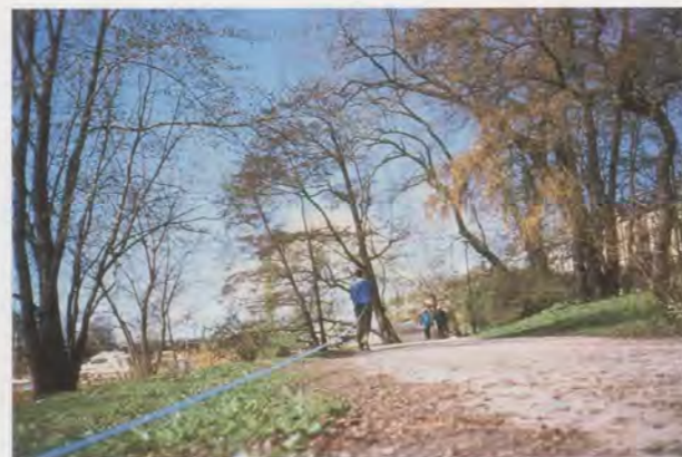
FRANCIS ALÿS, FAIRY TALES , Stockholm, 1998 / MÄRCHEN.

Mittlerweile ist das vorgeschlagene Diagramm natürlich überzogen mit Punkten und Schleifen, Linien und zickzackförmigen Strahlen, die zu Beweglichkeit oder Unbeweglichkeit neigen und in jeweils unterschiedlichen Codes stellvertretend für den Künstler selbst oder für jene stehen, die er für seine zwecklosen Zwecke rekrutiert, beziehungsweise für die, deren seltsames Verhalten er aus der immer wieder wechselnden Warte eines unerschütterlichen, unverdrossenen Aussenseiters beobachtet. Das vorgeschlagene analytische Hilfsmittel imitiert die regelgebundenen Vorstellungen, die wir vom späten Formalismus geerbt haben. Die Parameter von «Baudelaires Brettspiel» – ein Nebenprodukt des Versuchs die vorgegebenen Modelle eines erweiterten Skulpturbegriffs in Einklang zu bringen mit der tat-