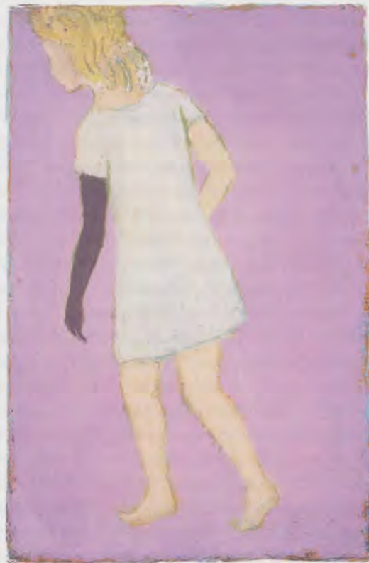
FRANCIS ALÿS, STUDY FOR "TWO SISTERS," 2001, diptych, part II, oil and encaustic on canvas on wood, 11 5 / 16 x 7 5 / 8 x 13 1 / 16 " / STUDIE FÜR «ZWEI SCHWESTERN», Diptychon, Teil II, Öl und Enkaustik auf Leinwand auf Holz, 28,8 x 19,4 x 2,1 cm.

mischen und deren Lebensweise anzunehmen versuchte, sich selbst als Fremdkörper in die «pittoreske» Wirklichkeit seiner arbeitslosen Nebenmänner einreicht und sich damit effektiv zum Spiegelbild anderer Touristen macht, die sich selbst in den Sehenswürdigkeiten «einnisten», die zu besichtigen sie gekommen sind. Deren Müsiggang ist unbeteiligtes Geniessen, die Untätigkeit des Klempners und Anstreichers dagegen banges Warten, und Alÿs' Nichtstun hebt beides hervor. Der Punkt im Diagramm, der «stellvertretend» für TURISTA (Tourist, Mexico City 1996) steht, ist ein einzelner Fixpunkt, der aber innerhalb seiner Grenzen Wiederholung erheischt, um eine längere und quälende Dauer zu bezeichnen.