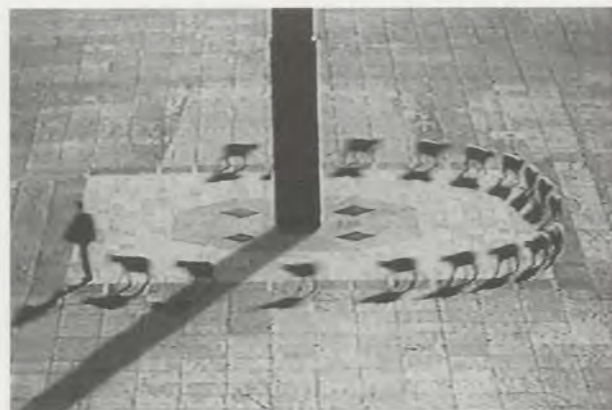
FRANCIS ALÿS, CUENTOS PATRIÓTICOS / PATRIOTIC TALES (MULTIPLICATION OF SHEEP), Mexico D.F., 1997, videogram / PATRIOTISCHE GESCHICHTEN (VERMEHRUNG DER SCHAFE), Videogramm.