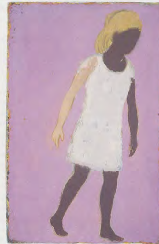
FRANCIS ALÿS, STUDY FOR "TWO SISTERS," 2001, diptych, part I / STUDIE FÜR «ZWEI SCHWESTERN», Diptychon, Teil I.

Die Aktionen, mit denen Alÿs die üblichen Verlaufsmuster des Alltags aufbricht, erstrecken sich jeweils über einen Teil der Stadt und es geht dabei meist um einen Vorgang der Anhäufung oder Verringerung. Sie sind immer vorsätzlich, durch Emotionslosigkeit und Understatement gekennzeichnet und in Anbetracht ihrer offenkundigen Ziellosigkeit überaus effizient. Und ob sie nun durch Videoaufnahmen oder Photos dokumentiert werden, die Bilder prägen sich tief ein. PARADOX OF PRAXIS, zum Beispiel, weist auf die sisyphusartige Dynamik von WHEN FAITH MOVES MOUNTAINS voraus. Während Erstere, eine Einpersonenperformance, für sich gesehen, die Vorstellung von Vergeblichkeit mit den Frustrationen von Samuel Becketts existenziellen Clowns verbindet, ist es im Zusammenhang mit Letz-