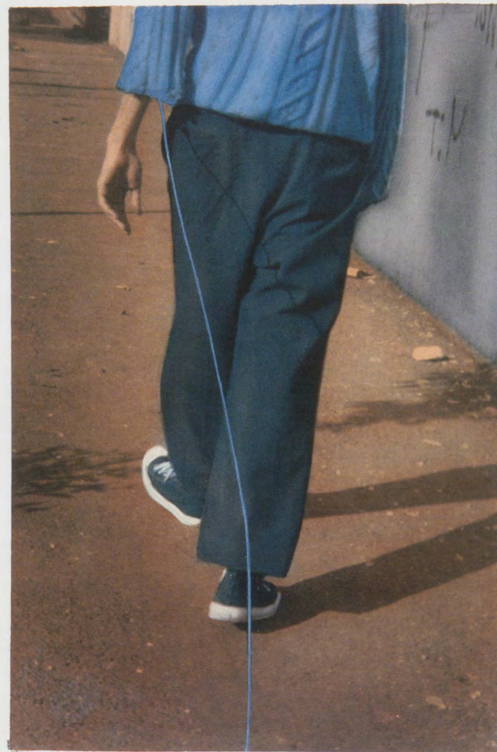
FRANCIS ALÿS, FAIRY TALES , Mexico D.F., 1992, photo document / MÄRCHEN, Photodokument.